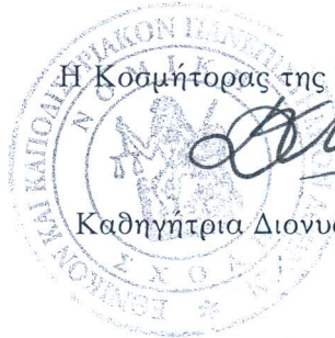
Καθηγήτρια Διονυσία Καλλινίκου